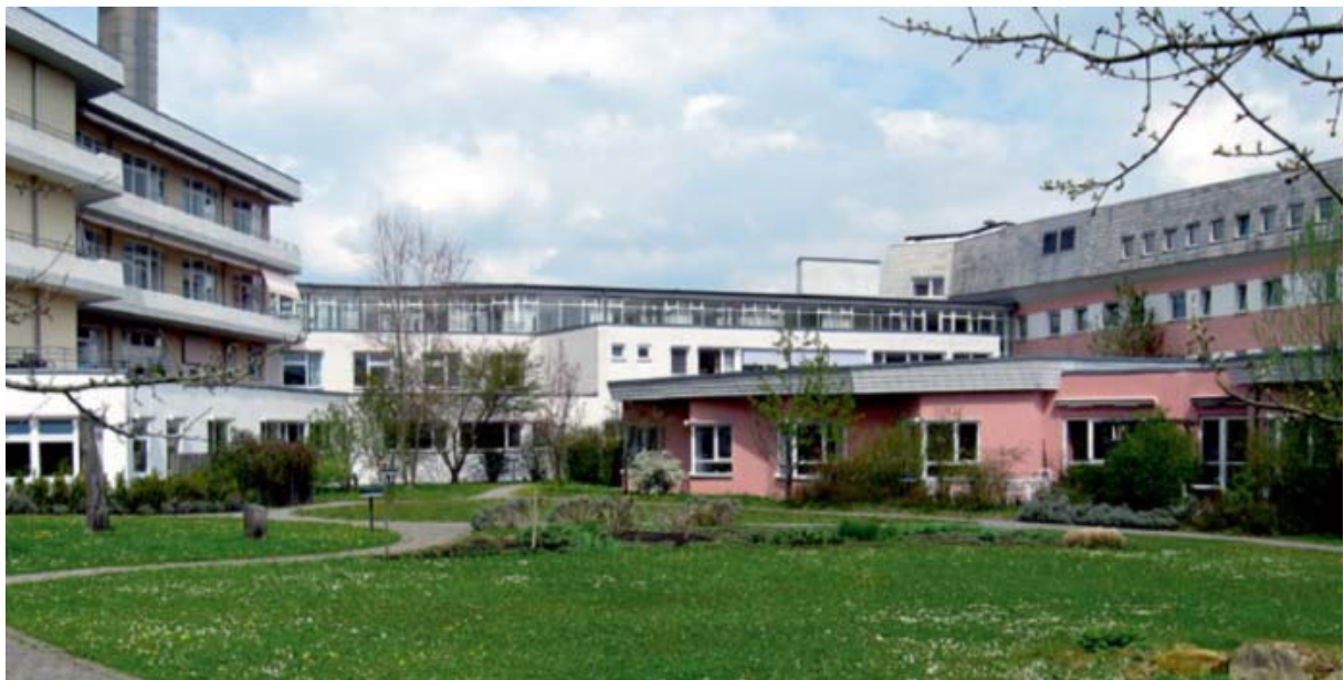
Filderclinic Filderstadt, Németország