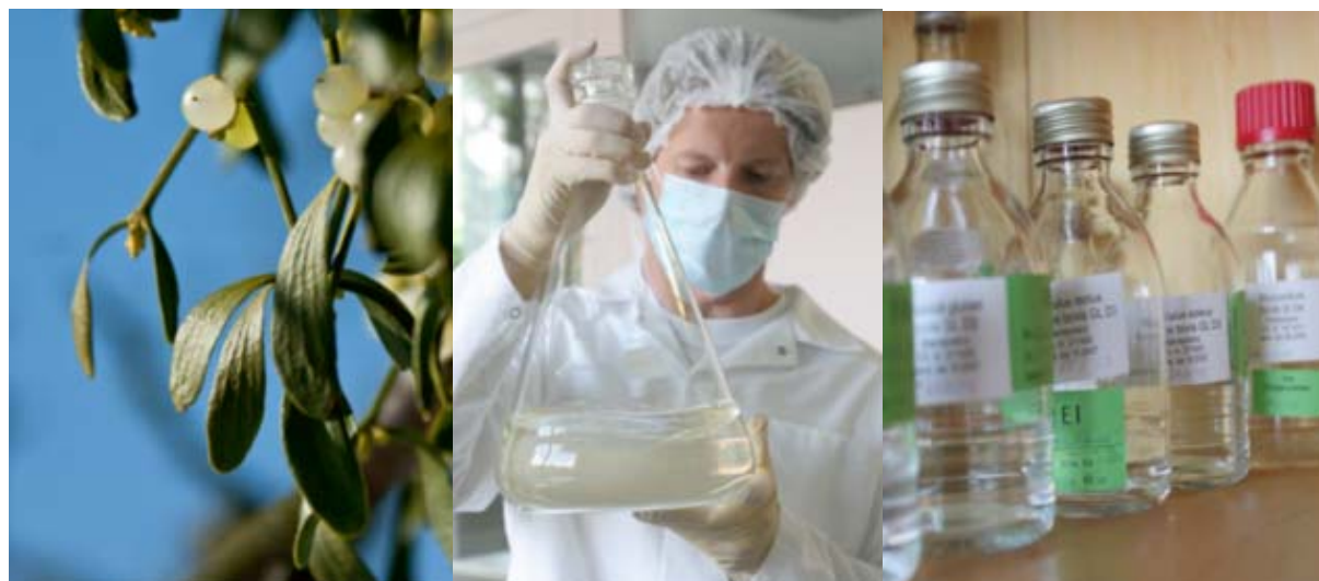
Viscum album – fehér fagyöngy